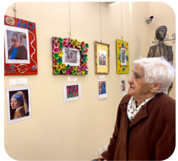
La mostra “Creativamente” alla Biblioteca Malatestiana

L'inaugurazione della mostra è stato un momento molto sentito, sia dagli ospiti che dalle famiglie perché ci ha permesso di trascorrere un pomeriggio diverso, valorizzando le persone e stimolando la socializzazione anche con chi è venuto a conoscerci per la prima volta”.