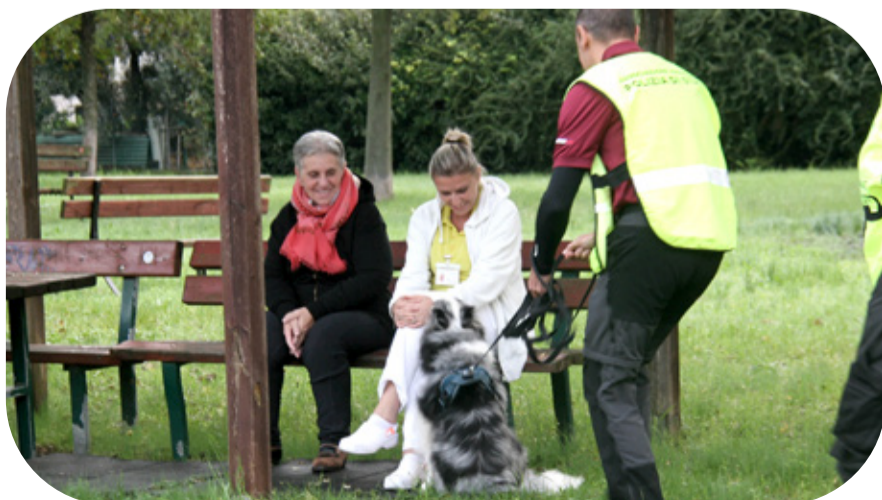
Un momento della simulazione di ricerca di una persona anziana fragile scomparsa