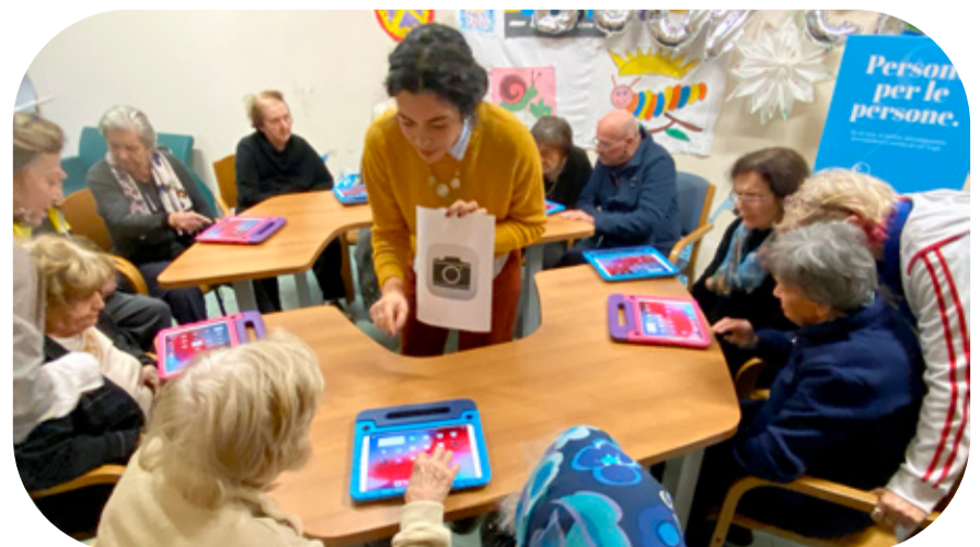
Il progetto “Mente Attiva” al Centro Diurno Violante Malatesta